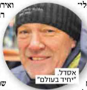
אסדל "חיד בעולם"

התשובה היא כסף וכוח, כמוכנן. נסיגת הקרחונים פתחה נתיב שיט חדש העובר דרך השטח הרוסי, והמומחים מעריכים כי כבר ב-2035 הוא יהיה פנוי ונטול קרחוני קיץ. הדרך הזו יכולה לצמצם ב-24 אחוז את משך ההפלגה בין קנדה, ארה"ב ואירופה, לחשוף משאבי נפט וגז רבים שלא היו נגישים עד כה, שלא לרבר על מאגר הרגים הענק - תעשייה שגילגלה בשנת 2021 כ-2.3 מיליארד דולר. השליטה באזור תבטיח גם את יכור לת ההתראה של המעצמות, שכן על האי ממוקם בסיס אנטי-טנות ענקי המחובר ל-14 לווייני תקשורת חשובים.