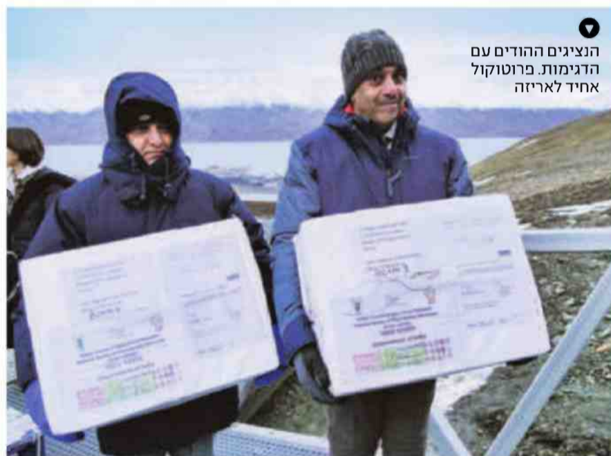
הנציגים ההודים עם הדגימות. פרוטוקול אחיד לאריזה

יהיה לגרל שוב את הדוגמאות ולשחזר את מאגר הזרעים, מסביר אסדל. התרחיש הנורא הזה כבר התממש ב-2015, כשכל מאגר הזרעים של הבנק הסורי הושמד במהלך מלחמת האזרחים. למרבה המזל, דוגמאות נוספות נשמרו גם בנורווגיה. "העברנו את הזרעים מכאן למרוקו, שם הם שוכפלו ואז הוחזרו לכאן. היום הם שומרים את העותק שלהם בלבנון", מספרים אנשי קרופ טראסט - עמותה בינלאומית שהוקמה על ידי ארגון המזון והחקלאות של האו"ם ב-2004 והתומכת ומלווה, בין היתר, את הבנקים הלאומיים בצורות המתפתחות.