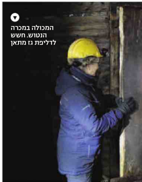
המכולה במכרה הנוטוש. חשש לדליפת גז מתאן

למרות התכנון הקפדני, ב־2016 ירדו בסבאלברד כמויות גשם חריגות שלא נרשמו בארכיפלג עד אז או מאז. כשמש־דרון הכניסה החיצונית הוצף, נזעקה התקשורת העולמית והתריעה כי הכספת בסכנה. "זה קרה כל שנה במהלך הפשרת השלגים